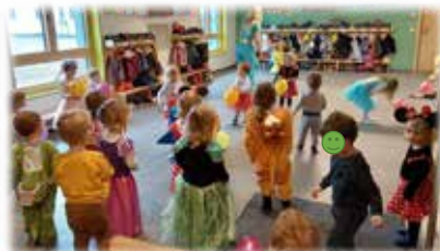
Das Team der Kinderoase

Abschließend kamen wir am Faschingsdienstag alle im Schlafanzug. Wir hatten eine tolle Faschingszeit und freuen uns schon auf nächstes Jahr!