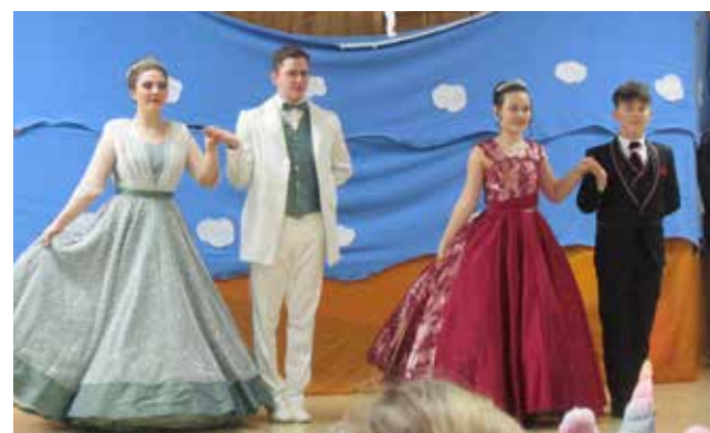
Grafik / Fotos / Text: Kindergarten Rennertshofen