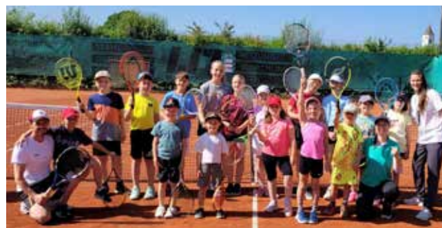
Ein voller Erfolg war das Tenniscamp in der ersten Pfingstferienwoche.

Freitag, 01.08.2025 , 15 Uhr: Saisonabschlussfest mit Finalspielen der Vereinsmeisterschaften (Erw.)