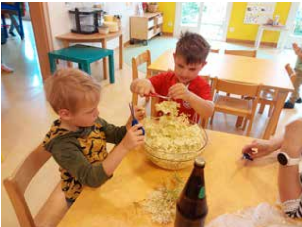
Grafik / Fotos / Text: Kindergarten Rennertshofen

Toll, was uns die Natur alles schenkt – dafür sagen wir „DANKE“!!!